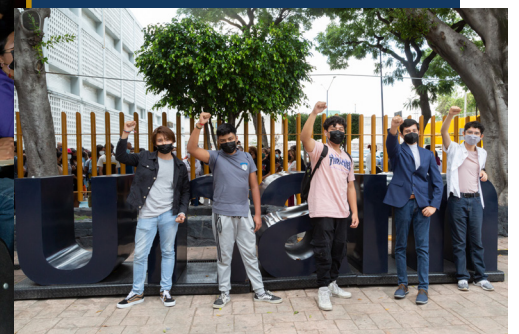
Prepa 9.