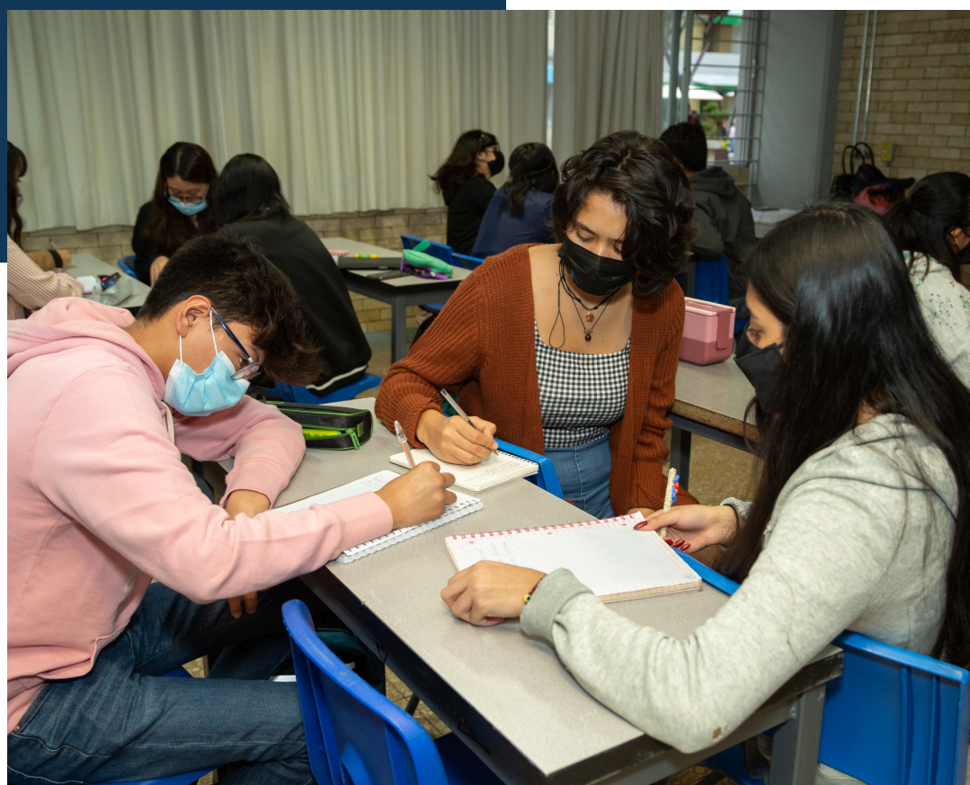
Trabajo en equipo en el plantel 2.

Las administraciones de cada plantel, dijo, son muy comprometidas y están al pendiente de los alumnos tanto al interior del recinto como a sus alrededores; sin embargo, la formación de los jóvenes debe ser trabajo en equipo, por lo cual solicitó